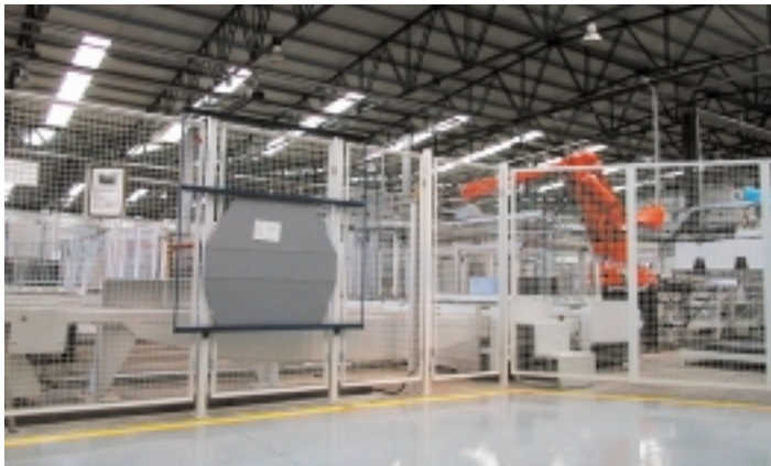
Interior de las instalaciones de Tailor Metal