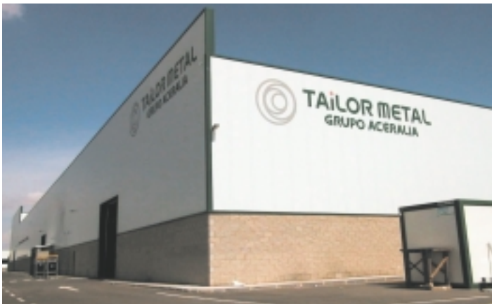
Instalaciones de Tailor Metal

Tras las reformas realizadas en parte de los servicios, se han eliminado algunas duchas y se han sustituido los cabezales de las restantes por los modelos propuestos.