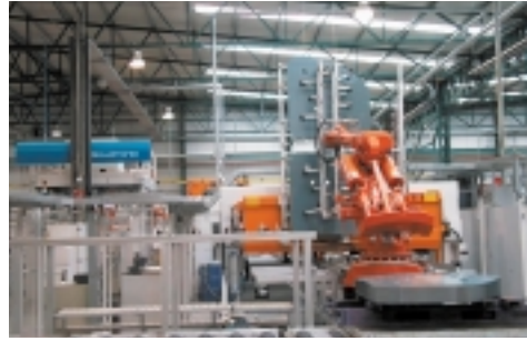
Maquinaria para la producción de chapas soldadas