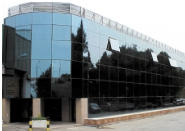
Edificio de oficinas de la empresa LACKEY

LACKEY, S.A. dispone de un sistema de Calidad implantado y certificados de acuerdo a la norma UNE-EN-ISO 9001:94, con fecha de emisión diciembre de 1997 y un Sistema de