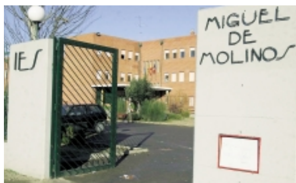
Entrada al centro

Otra de las características de este jardín es que, desde el curso 2002/2003, el mantenimiento es realizado por los propios alumnos del centro.