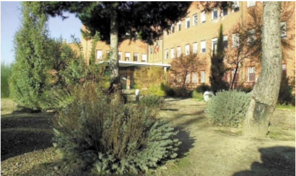
Vista general del jardín

No obstante, y teniendo en cuenta el tipo de plantas instaladas, y las indicaciones generales de riego, la disminución de consumo podría superar fácilmente el 50%