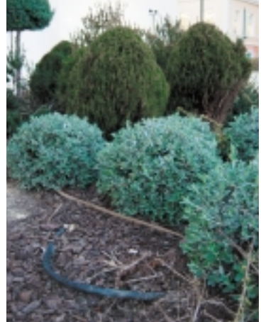
Recubrimientos y riego por goteo