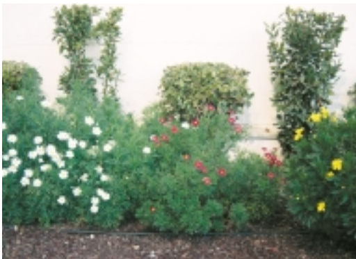
Ejemplo de jardinera