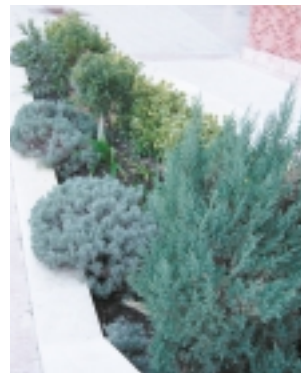
Detalle de jardinera