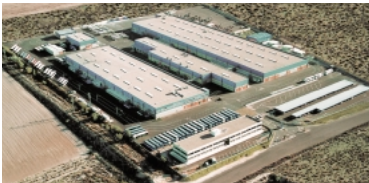
Hispano Carrocera, S.A.