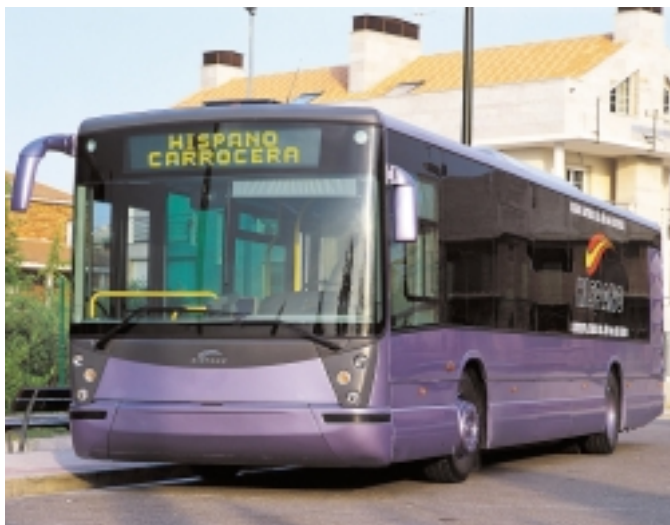
Autocar modelo "Habit" fabricado por Hispánico Carrocera