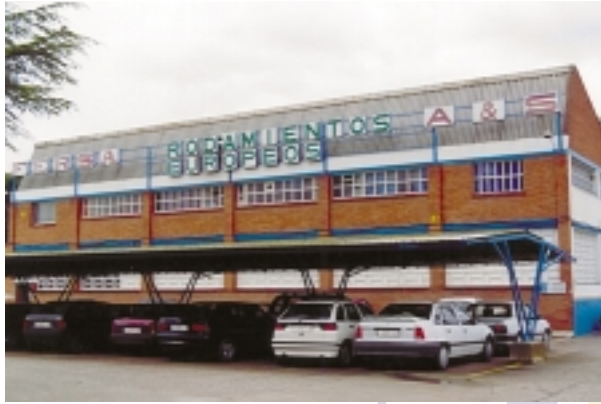
Vista general de la planta de FERSA Fábricas Europeas de Rodamientos

Igualmente se instaló una dosificación automática de las taladrinas así como una instalación centralizada de los baños de taladrinas.