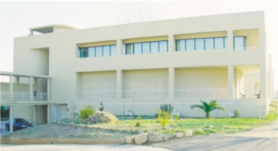
Instalaciones de la Residencia Rey Ardid

La combinación de ambas actuaciones ha permitido alcanzar reducidos valores de consumo unitario.